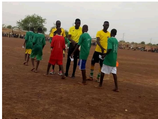
La finale du tournoi de football (OSEP) 2019 ; Toujours un grand moment de la journée !

Le nombre d'élèves augmentant, le budget est aussi à la hausse. Notre participation sera de 600 000 FCFA soit 1000 €, somme moins importante que l'an passé, soutien financé par les actions menées par l'école de Poincy et les centres de loisirs de Trilport.